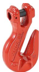
Elo de Ligação